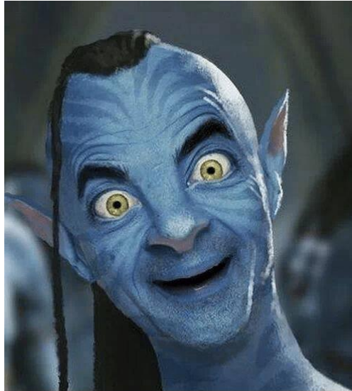
Funny Avatar Mr Bean

Diene film me al die blauwe figuren was echt super coooooool!!! Ze gaan er blijkbaar nog 6 films van maken?!? Shit moatje dan gaan we da gwn naspelen ofzoooooo kwn? Schilder u allemaal blauw en laat u haar groeien! Dan gaan we springen van bomen, jagen op wilde beesten en ons afvragen of da wel ethisch verantwoord is wa die mannen doen met die beesten