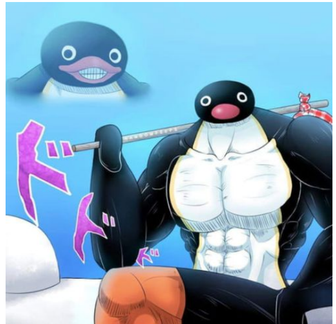
When she says "Noot on me daddy"