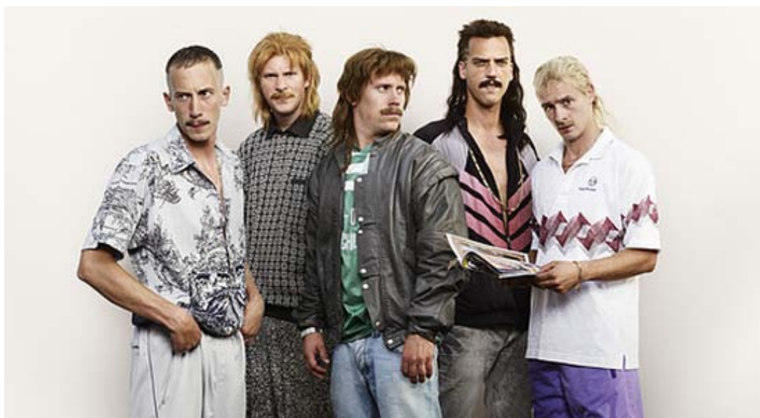
Boven: New kids. Deze jongens zijn een bron van inspiratie in ons leven.

Vanavond gaan we doen waar we goed in zijn: marginaal doen! “verkleed” (uhum) jullie dus allemaal! EN STAMPEEEEEUUH